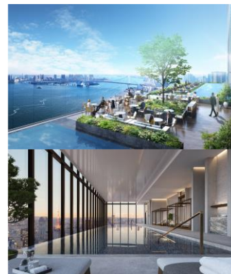
【オーシャンビューとシティビューの施設】

【2022 年 5 月 23 日発表「フェアモント東京」芝浦・浜松町エリアに 2025 年度開業】 URL: https://www.nomura-re-hd.co.jp/cfiles/news/n2022052302033.pdf