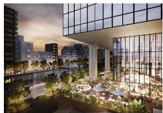
【運河に面するフードホール】

低層部の商業施設では、芝浦運河や船着場、浜松町駅との緑のアプローチとシームレスにつながり、水辺に面したバルコニーや緑に囲まれたテラス等自然を感じられる空間づくりを行います。飲食店を中心に約 40 店舗で構成されており、「TOKYO WORKation」の一端を担い、オフィスラウンジのような使い方から、忙しい利用者のランチや充実のディナータイム利用まで幅広いニーズに応えます。イベント施設としての機能も兼ね備え、芝浦エリアの「まちのリビングルーム」のように暖かい空間として、地域コミュニティ醸成を目指します。