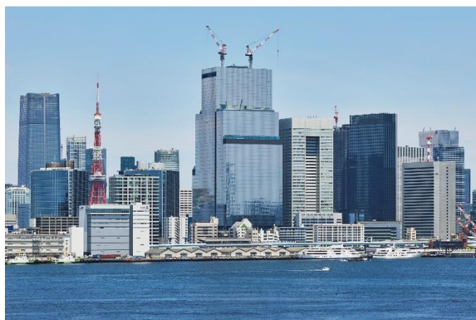
【S 棟の工事状況・2024 年 5 月下旬時点】