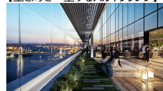
【空と海を一望するスカイラウンジ】

中層部のオフィフロアでは、都内有数の約 1,500 坪のメガプレートを備えており、一人ひとりに寄り添う、芝浦の豊かな自然環境を活かした「TOKYO WORKation」を提唱しています。空と海の開放感を体感できるテラス付きの共用部「スカイラウンジ」をはじめ、街全体をワークスペースとして利用でき、その多様なワークスペースをアプリ等のデジタルの施策で支援します。一人ひとりがより良いパフォーマンスを発揮できるように、そのコンディションに合わせたワークシーンを選択できる働き方を実現します。